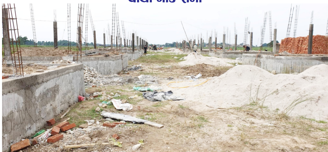
निर्माणधिन नमुना सन्थाल बस्ती