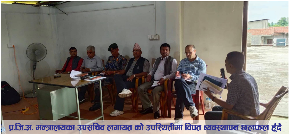
प्र.जि.अ. मन्त्रालयका उपसचिव लगायत को उपस्थितीमा विपत व्यवस्थापन छलफल हुँदै