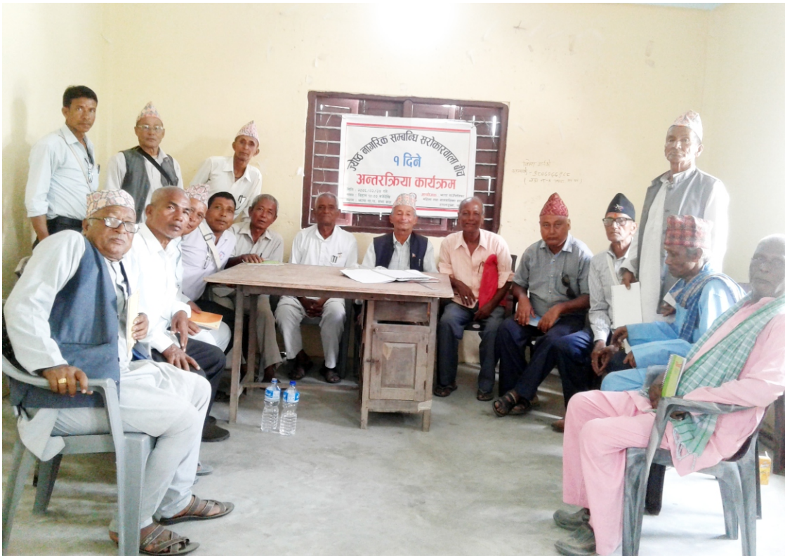
ज्येष्ठ नागरिक अन्तरक्रिया