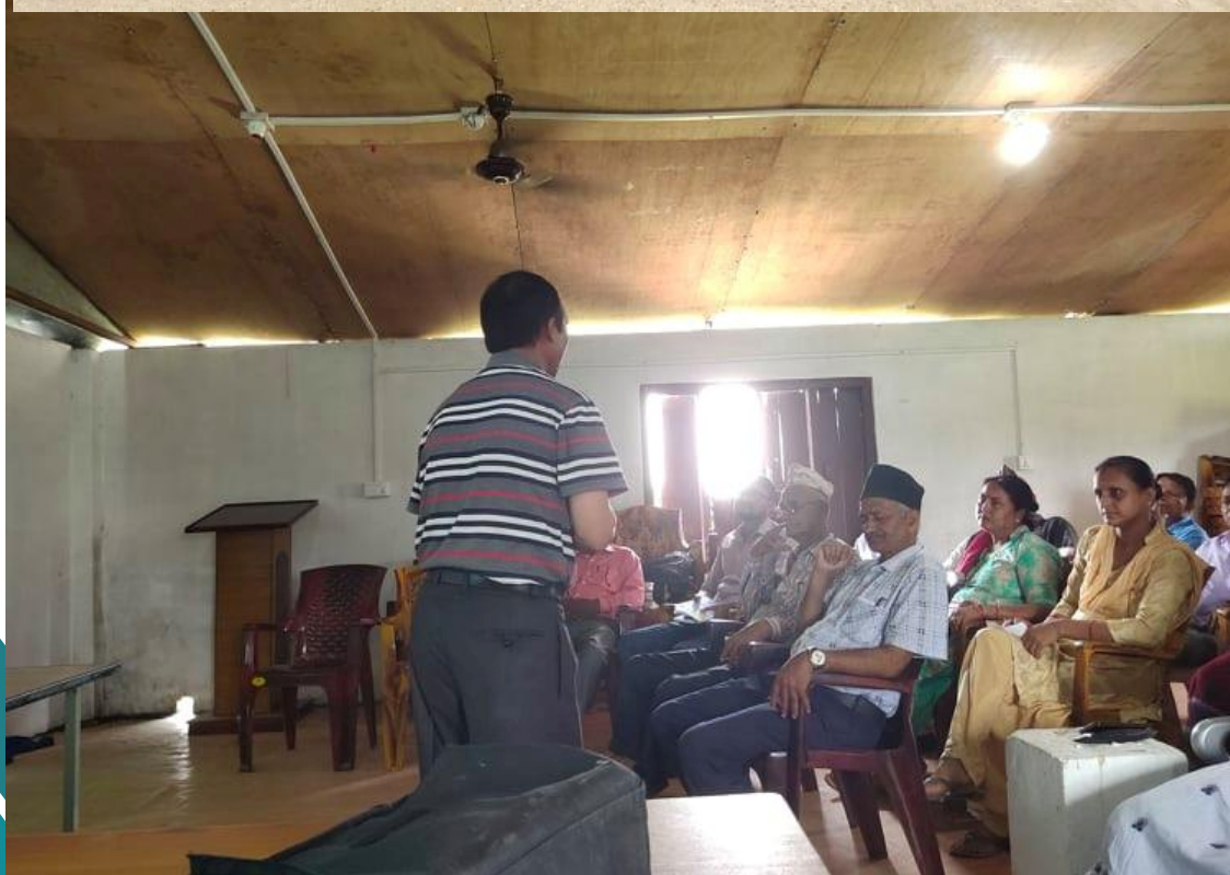
राजस्व परामर्ष सम्बन्धी अन्तर्क्रिया