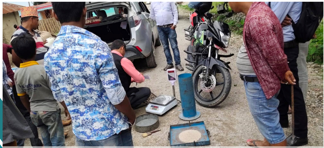
निर्माणार्थिन कालोपत्रे सडक अर्न्तगत बेस लेभल सम्मको फिल्डडेन्सीटी परिक्षण