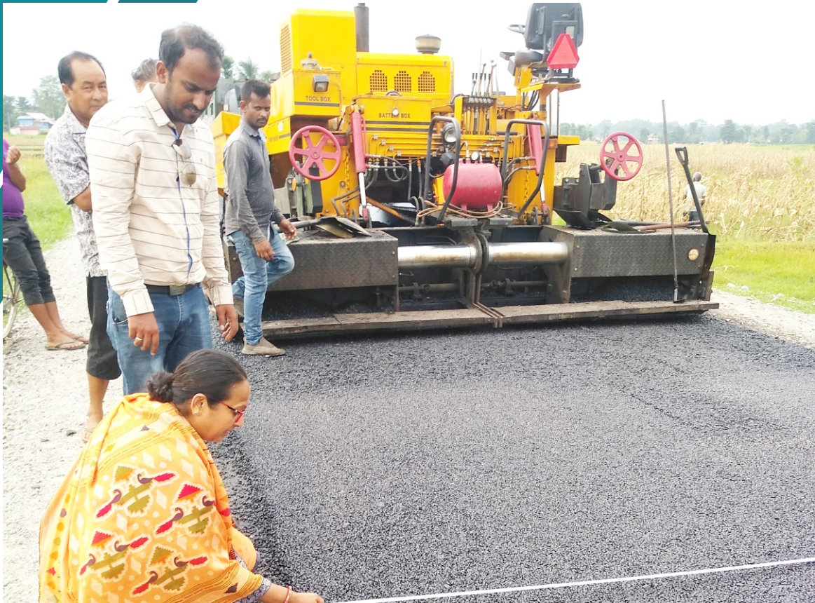
निर्माणाधिन सडक अनुगमन तथा नाप जाँच