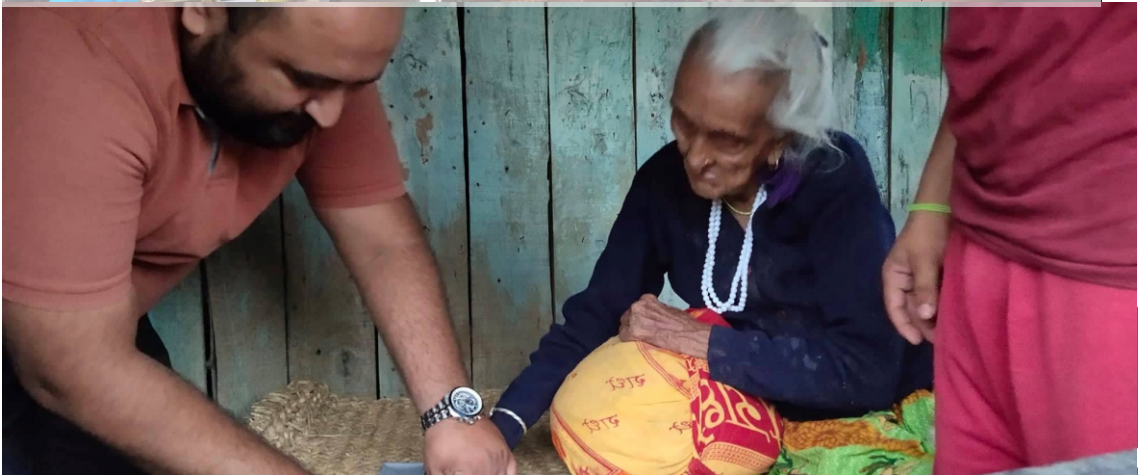
चौरासि नाघेका ज्येष्ठ नागरिकका लागि घरैमा भत्ता वितरण