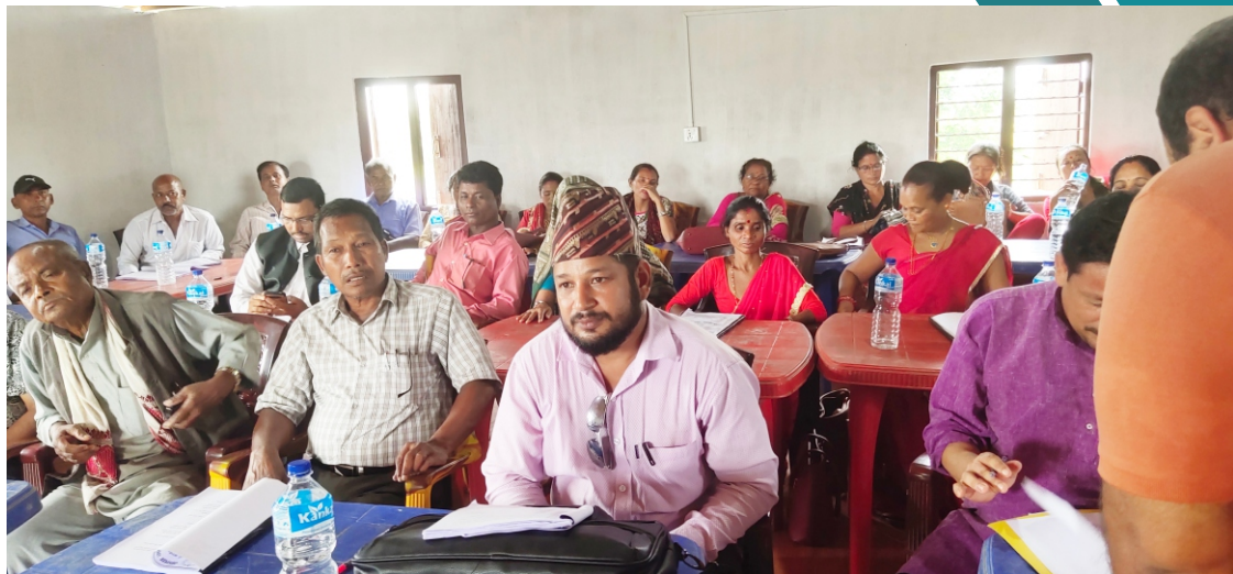
चौथो गाउँ सभा