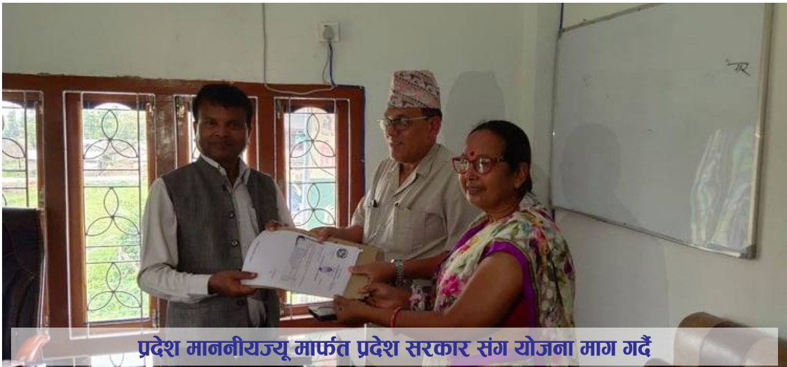
प्रदेश माननीयज्यू मार्फत प्रदेश सरकार संग योजना माग गर्दै