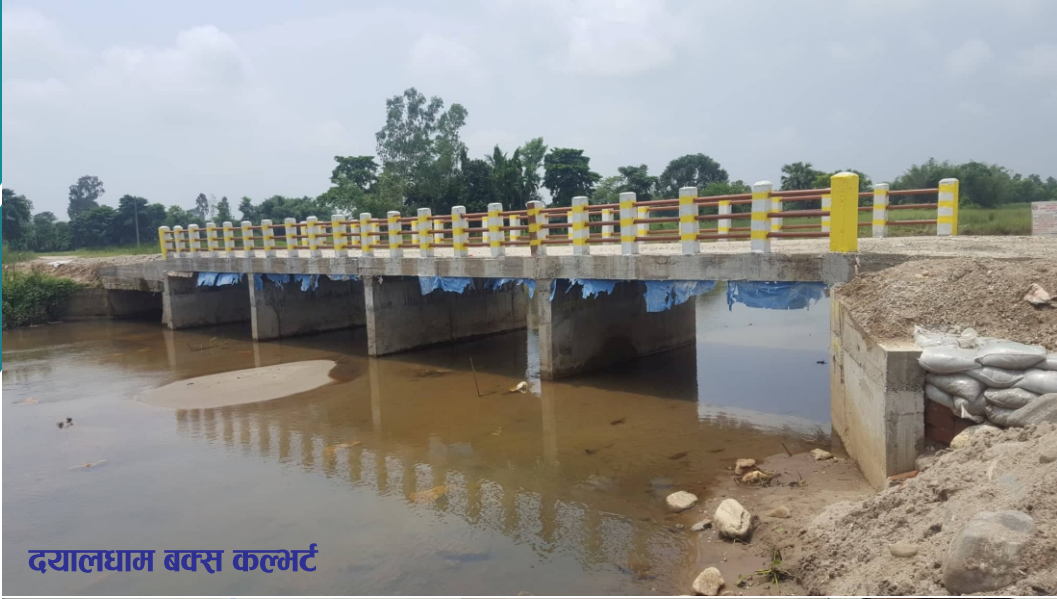
दयालघाम बक्स कल्भर्ट