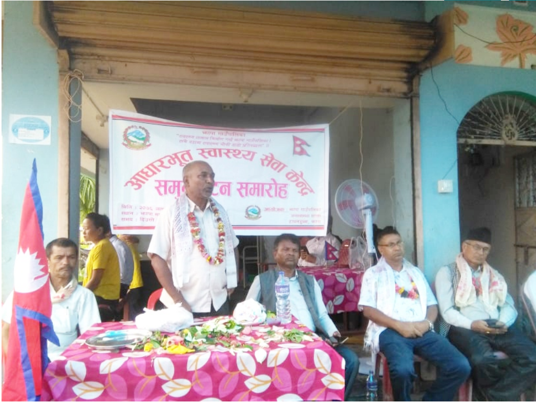
आधारभूत स्वास्थ्य सेवा केन्द्र १ को उदघाटन