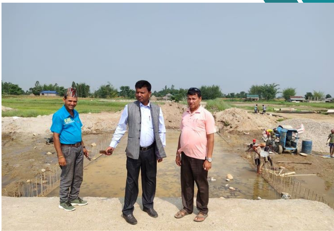
दयालघाम कल्भर्टको कार्य प्रारम्भ हुँदाको अवस्था