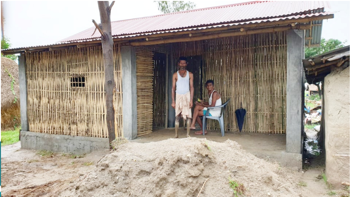
विपन्न समुदायका लागि साभेदारीमा आवास निर्माण