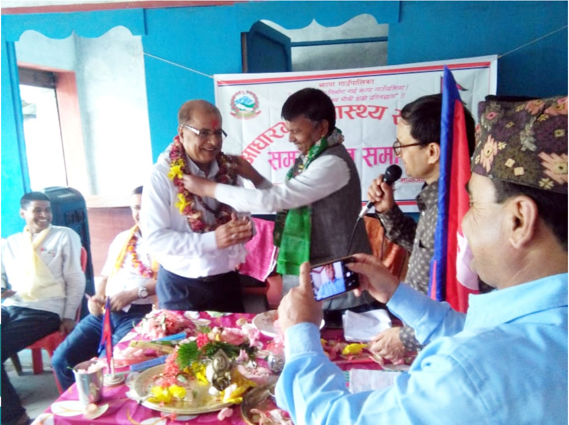
आधारभूत स्वास्थ्य सेवा केन्द्र वडा नं ७ को उदघाटन