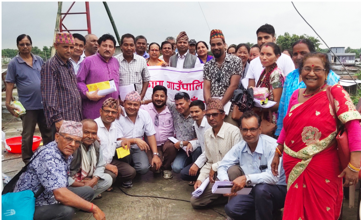
चौथो गाउँसभा सम्पन्न भएपछिको सामुहिक तस्विर