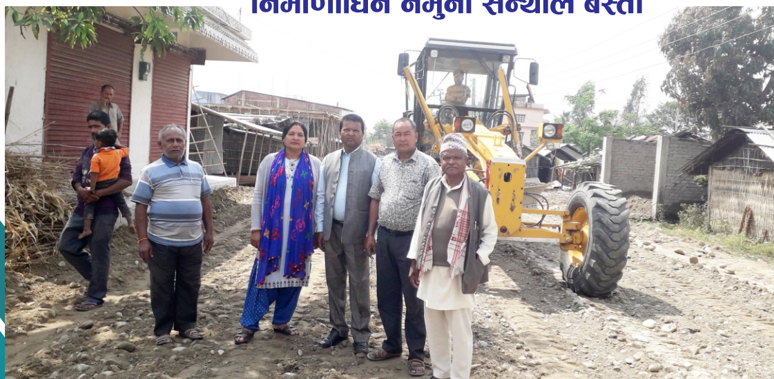
निर्माणधिन सडक अनुगमन