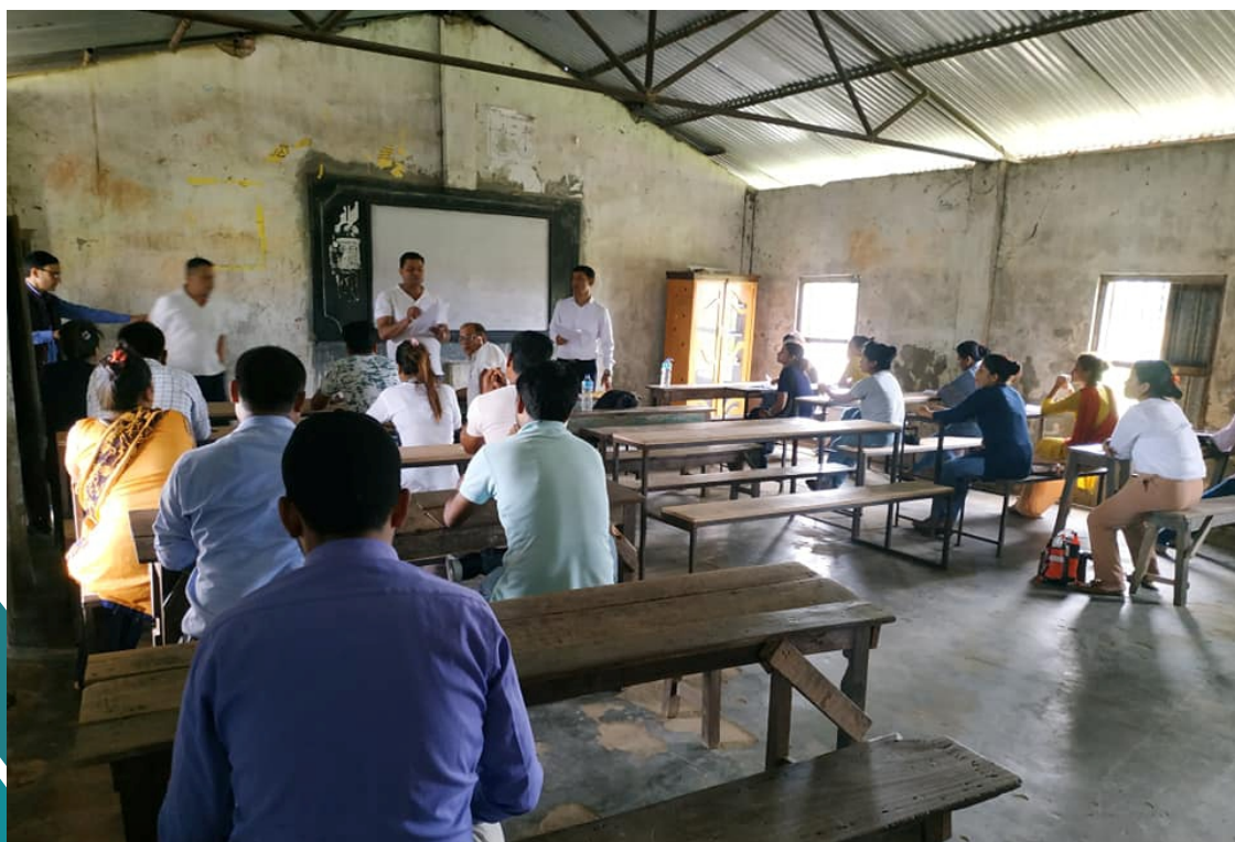
आधारभूत स्वास्थ्य सेवा केन्द्रको परिक्षा