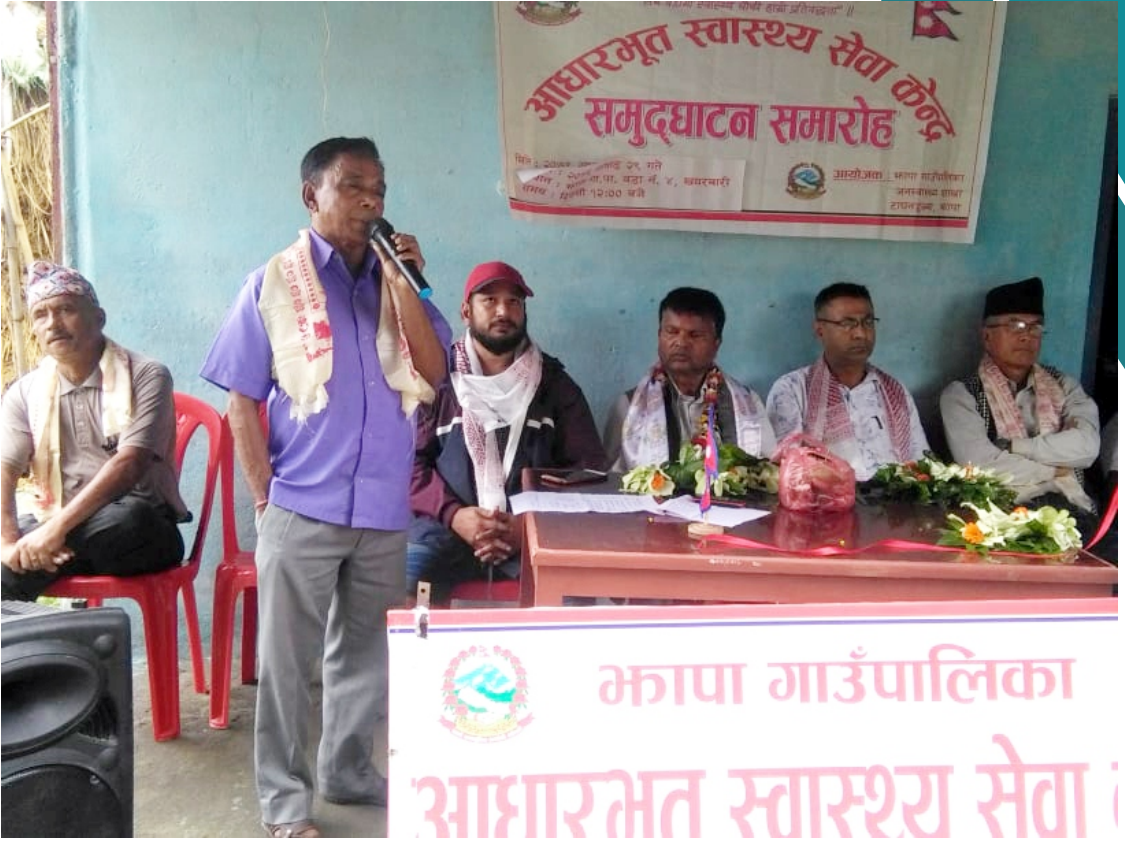
आधारभूत स्वास्थ्य सेवा केन्द्र उदघाटन