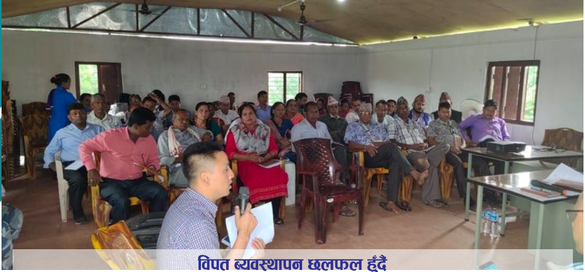
विपत व्यवस्थापन छलफल हुँदै