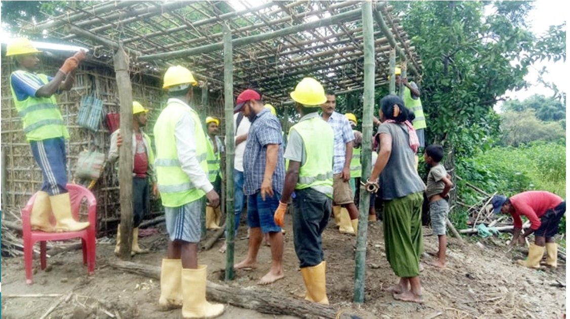
प्रधानमन्त्री रोजगार कार्यक्रम अर्न्तगत वाडी पिडीतकालागि आवास निर्माण