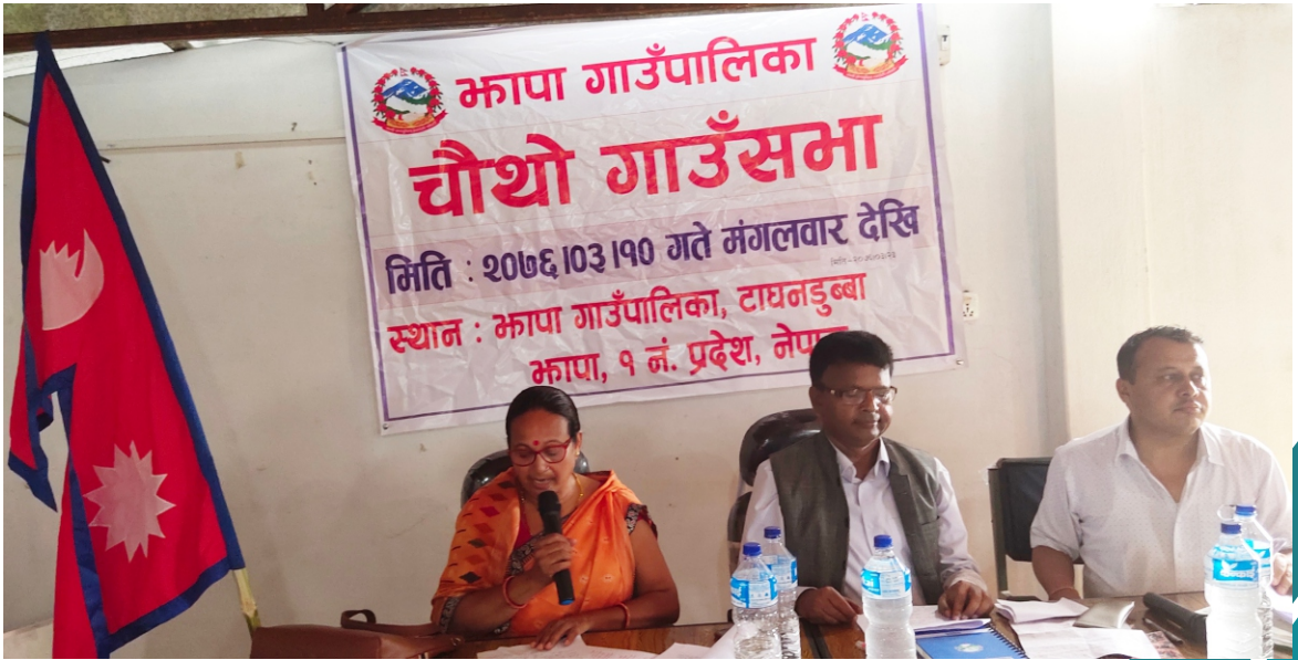
चौथो गाउँसभा सञ्चालन हुँदै