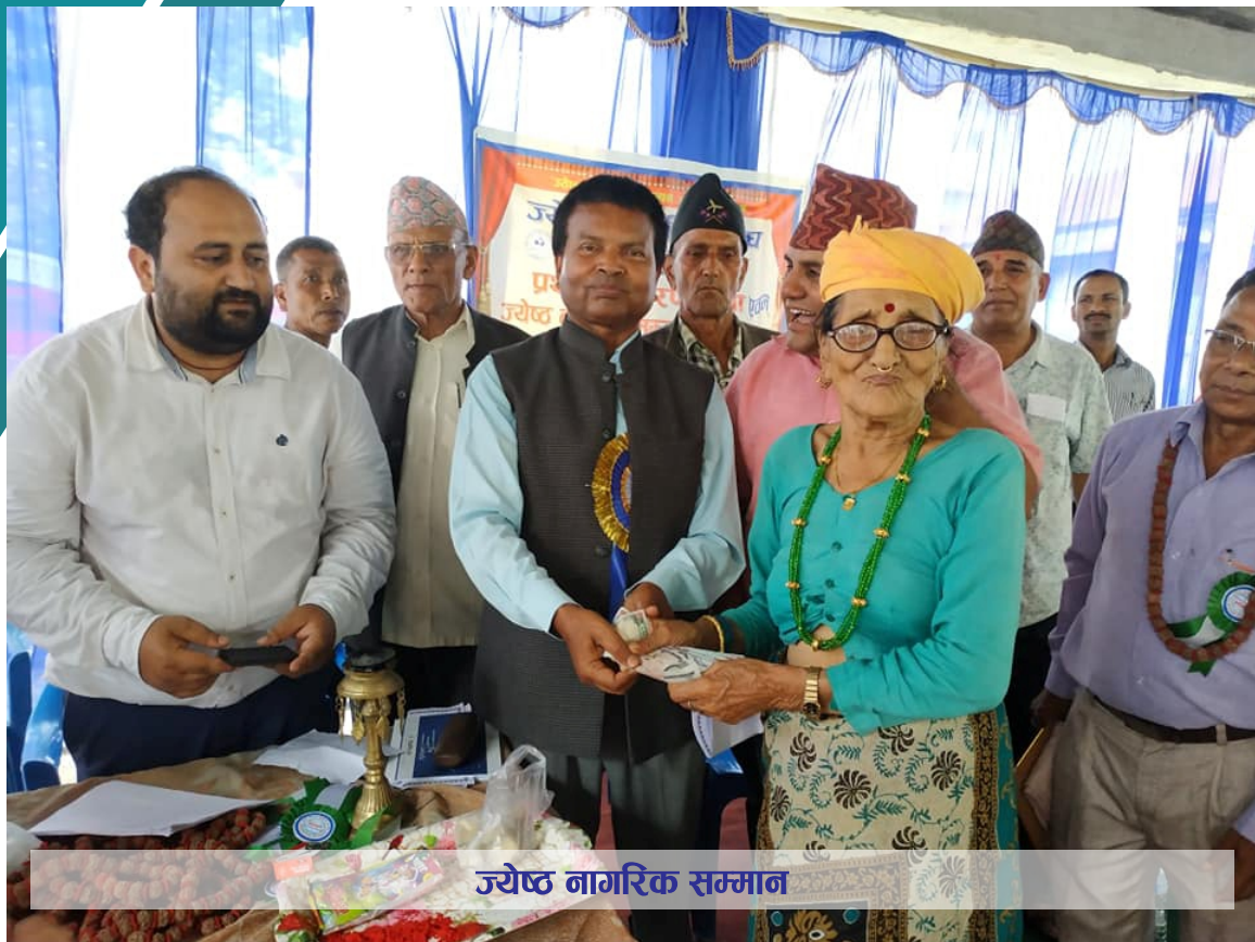
ज्येष्ठ नागरिक सम्मान