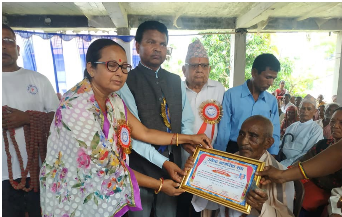
ज्येष्ठ नागरिक सम्मान