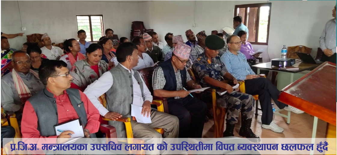
प्र.जि.अ. मन्त्रालयका उपसचिव लगायत को उपस्थितीमा विपत व्यवस्थापन छलफल हुँदै