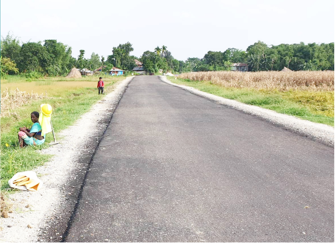
कालोपत्रे सडक निर्माण पश्चात