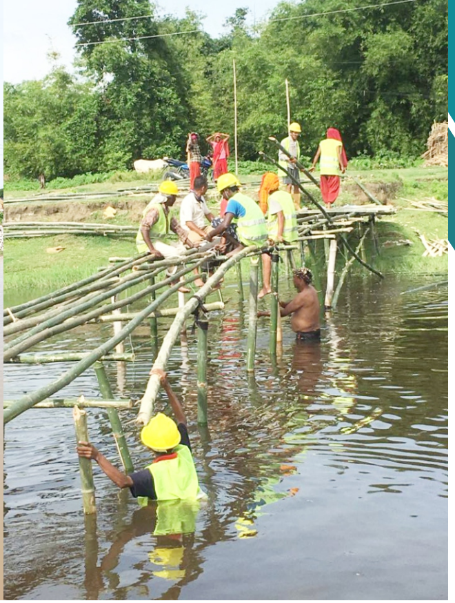
प्रधानमन्त्री रोजगार कार्यक्रम अर्न्तगत वासे पुल निर्माण