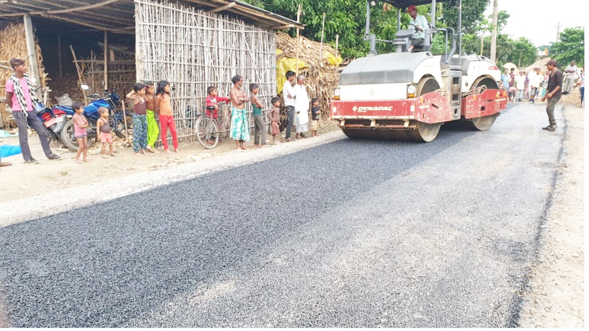
सडक कालोपत्रे गर्ने कार्य हुदै