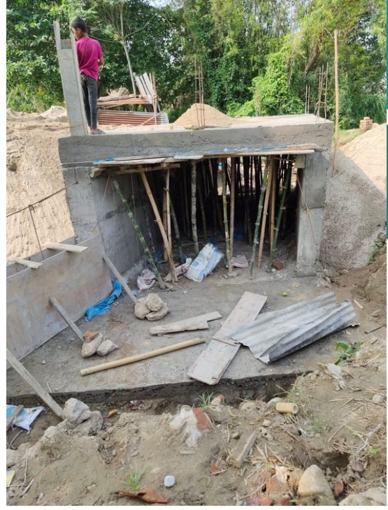
निर्माणाघिन दयालधाम मार्गको कल्भर्ट