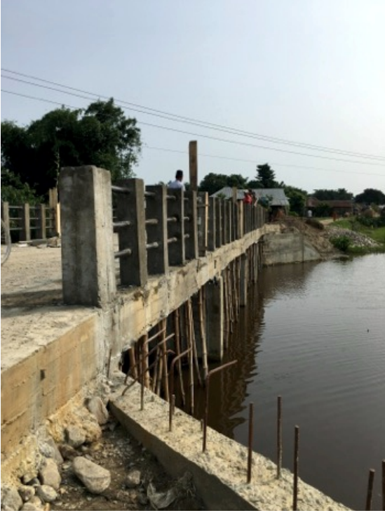
निर्माणाघिन होक्लावारी बक्स कल्भर्ट