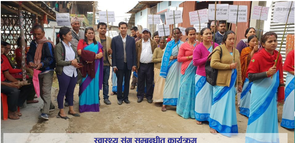
स्वास्थ्य संग सम्बन्धीत कार्यक्रम