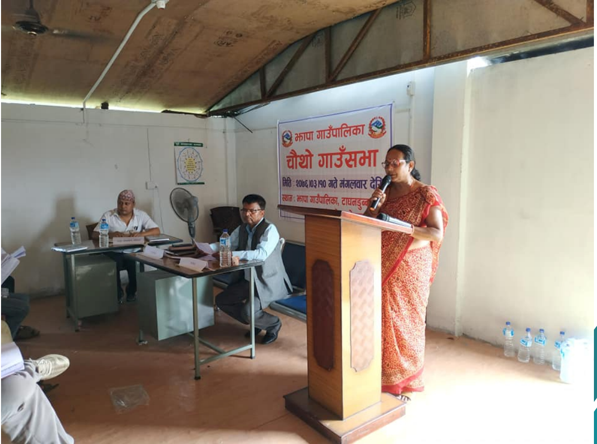
चौथो गाउँ सभामा नीति कार्यक्रम तथा बजेट प्रस्तुत गनुहुदै उपाध्यक्ष