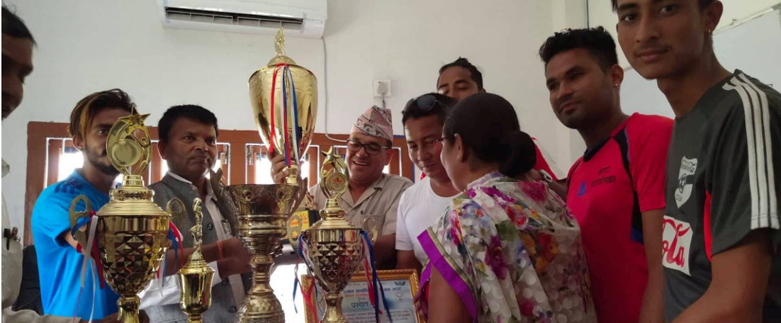
गाउँपालिकालाई ट्रफि हस्तान्तरण गरिदै साथमा प्रदेश सांसदज्यू